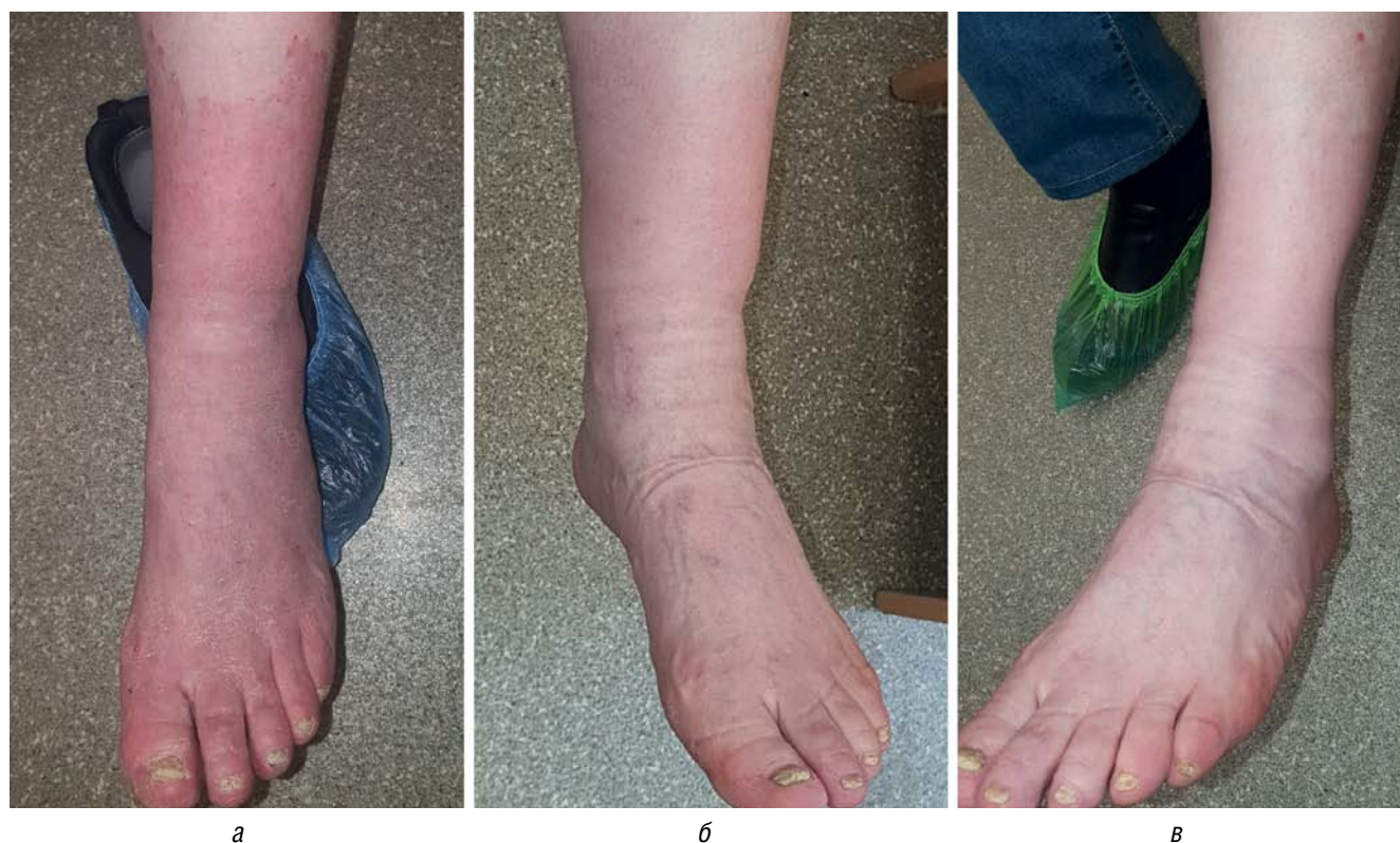
Рис. 3. Онихомикоз, вызванный T. interdigitale . а — микоз кожи правой стопы и нижней трети голени и тотальный онихомикоз, вызванные T. interdigitale , у больного 65 лет, развившиеся на фоне анкилозирующего спондилита и приема метотрексата — 15 мг в неделю в течение 10 лет; б — полное разрешение микоза кожи на фоне применения крема с сертаконазолом через 3 недели от начала лечения; в — отсутствие рецидивов микоза кожи на фоне профилактического применения лака Лоцерил® (5% аморолфин) 1 раз в неделю

Пациенту была назначена только наружная терапия: для кожи — кремом с сертаконазолом 2 раза в день