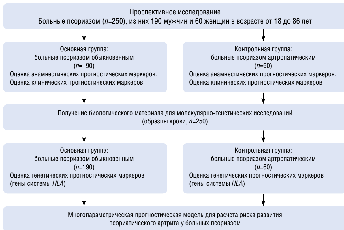
Рис. 1. Дизайн исследования Fig. 1. Study design

(1 × 500 мкл), промаркированные пробирки хранили в морозильной камере при -20^{\circ}\text{C} до проведения молекулярно-генетических исследований.