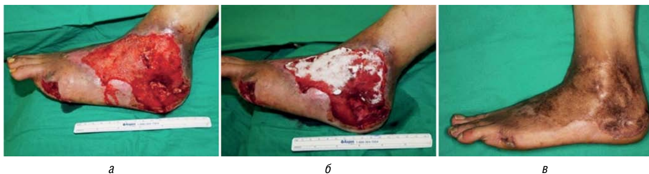
Рис. 4. Результаты терапии с использованием дермального заменителя Matriderm: а — повреждение мягких тканей стопы в результате сильного ожога; б — нанесение кожного заменителя Matriderm поверх раны после проведения санации; в — 10 месяцев после имплантации. Эстетический результат и анализ кожных покровов в месте трансплантации оцениваются как хорошие [80]

Fig. 4. The results of therapy using the dermal substitute Matriderm: а — soft tissue injury of the foot as a result of severe burns; б — applying a Matriderm skin substitute over the wound after sanitization; в — 10 months after the operation. The aesthetic result and the analysis of the skin at the site of transplantation are assessed as good [80]