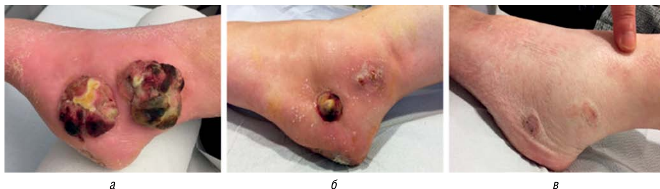
Рис. 3. Результат прохождения терапии при применении препарата IMLYGIC пациентом 62 лет, обратившимся к специалистам с двумя крупными поражениями лодыжки и метастазами в лимфатических узлах, вызванными акральной меланомой. Пациент проходил курс лечения IMLYGIC на протяжении двух лет, добившись полной ремиссии, которая также наблюдалась спустя два года после окончания терапии: а — при первичном осмотре; б — спустя 6 месяцев после назначения IMLYGIC; в — спустя 12 месяцев после назначения IMLYGIC Fig. 3. The results of IMLYGIC therapy received by a 62-year-old patient presented with 2 huge malleolar lesions and metastasis in the lymph nodes caused by acral melanoma. The patient underwent therapy with the IMLYGIC for 2 years, achieving complete remission, which was also observed 2 years later after the end of therapy: a — during the initial examination; б — 6 months after the prescription of IMLYGIC; в — 12 months after the prescription of IMLYGIC

ний, как псориаз и рассеянный склероз [22]. Несмотря на большие успехи в изучении вирусных векторов, уже применяемых для лечения различных заболеваний кожи, у данного подхода существует ряд недостатков: онкогенез, иммуногенность, специфичность трансгенной доставки, ограниченная способность упаковки ДНК, сложность производства векторов [8–10].