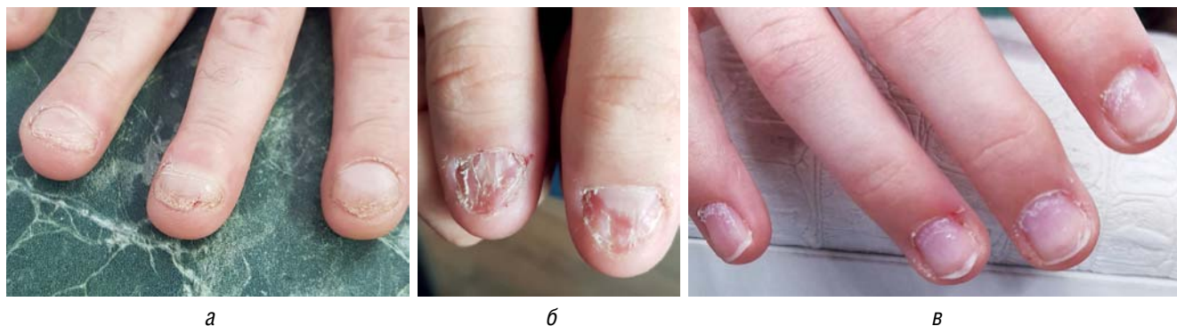
Рис. 3. Ламеллярный онихолизис у пациентов на свободном крае (а) и центральной части (б, в) ногтевых пластин Fig. 3. Lamellar onychoschisis in patients on the free edge (a) and central part (б, в) of nail plates

Описанные изменения ногтевого аппарата при онихофагии представлены в табл. 1.