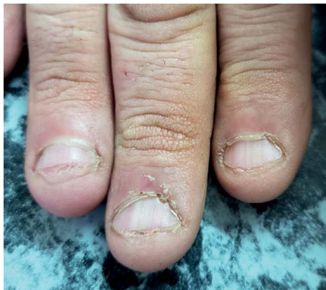
Рис. 2. Укорочение и общее уменьшение ногтевых пластин у пациента с онихофагией Fig. 2. Shortening and overall reduction of nail plates in a patient with onychophagia

В клинической картине поражений ногтей при онихофагии преобладают дистрофии ногтей, преимущественно атрофического типа. Ведущим типом дистрофии при онихофагии является онихолизис — расслоение свободного края ногтя [19]. Учитывая, что механическому раздражению в виде укусов подвергается не только свободный край, но и вся ногтевая пластина, явления расслоения могут присутствовать по всей длине ногтя, что называется пластинчатым (ламеллярным) онихолизисом [16] (рис. 3).