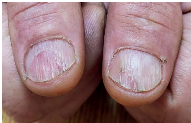
Рис. 4. Множественные выраженные продольные борозды, ламеллярный онихолизис и продольные кровоизлияния ногтевого ложа у пациента с онихофагией

Fig. 4. Multiple pronounced longitudinal furrows, lamellar onychochisis and longitudinal hemorrhages of the nail bed in a patient with onychophagia