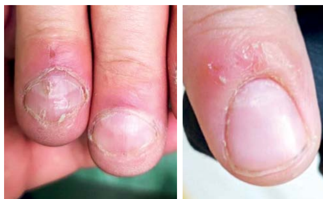
Fig. 4. Multiple pronounced longitudinal furrows, lamellar onychochisis and longitudinal hemorrhages of the nail bed in a patient with onychophagia