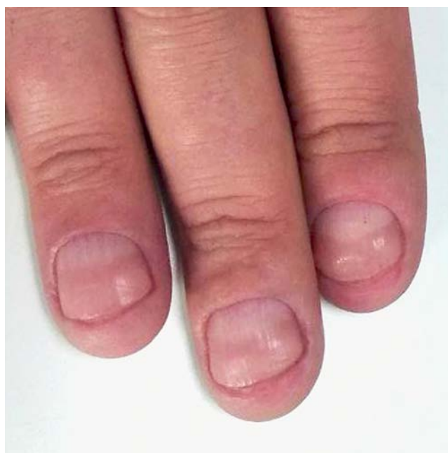
Рис. 6. Макролулула у пациента с онихофагией Fig. 6. Macrolunula in a patient with onychophagia