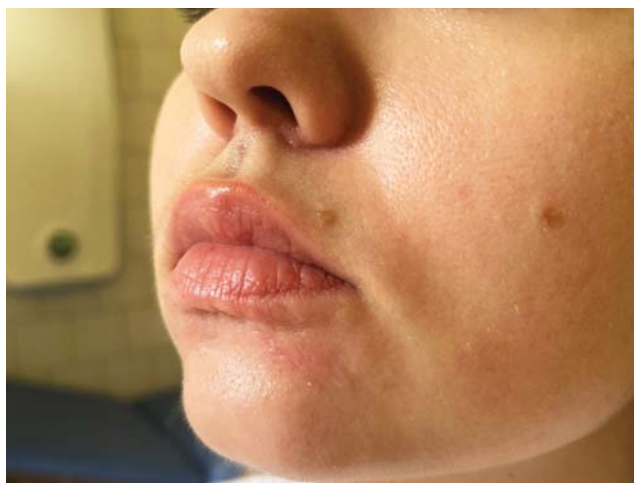
Рис. 6. Через месяц после выполнения двух процедур фракционного фототермолиза отмечалось практически полное разрешение очага Fig. 6. One month after 2 fractional photothermolysis procedures, the lesion was almost completely resolved

ным отеком и невротией лицевого нерва, в 1931 г. немецкий невролог Генрих Розенталь описал еще один характерный симптом — складчатый язык. Заболевание встречается с частотой 0,08% в общей популяции. Симптомы чаще всего проявляются в возрасте от 25 до 40 лет, женщины болеют чаще мужчин (соотношение 2:1) [5].