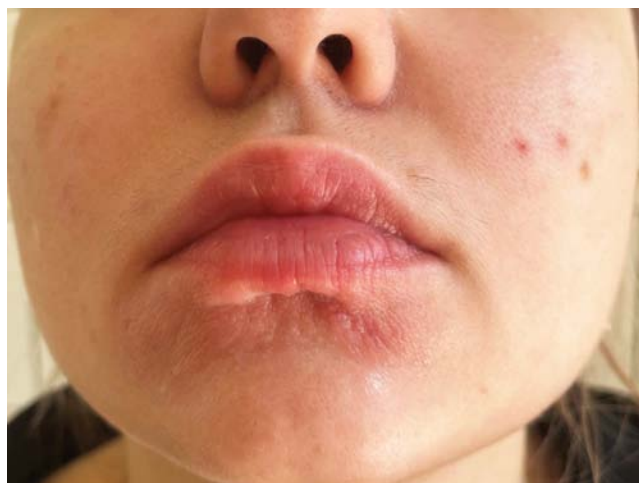
Рис. 5. После четырех процедур обкалывания суспензии бетаметазона дипропионата отмечалось снижение интенсивности окраски элементов, уменьшение плотности отека Fig. 5. After four injections of betamethasone dipropionate suspension, there was the coloration of the elements decreased and the edema volume reduced