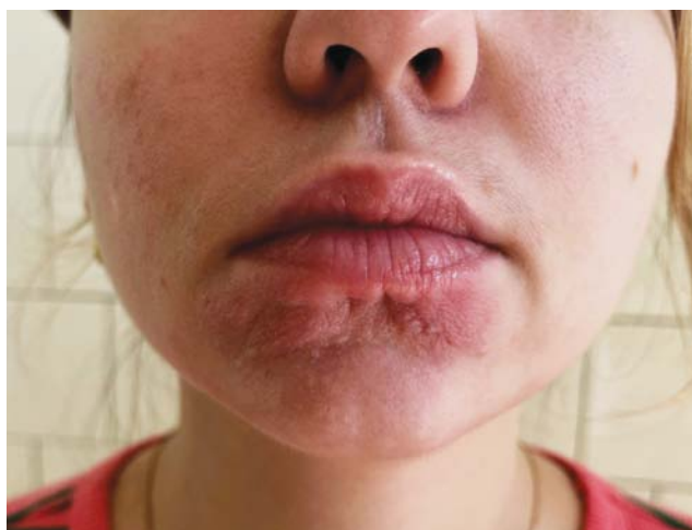
Рис. 1. Клиническая картина до начала терапии была представлена инфильтрированной бляшкой плотной консистенции, ярко-розового цвета, размером 8 × 4 см, нижняя губа отечная, плотноэластической консистенции Fig. 1. At baseline, the patient had an infiltrated plaque with a dense consistency, bright pink color and a size of 8 × 4 cm. The lower lip was swollen and had a dense-elastic consistency

С целью уточнения диагноза проведена диагностическая биопсия кожи. При гистологическом исследовании в дерме на фоне отека были обнаружены многочисленные мелкие эпителиоидно-клеточные