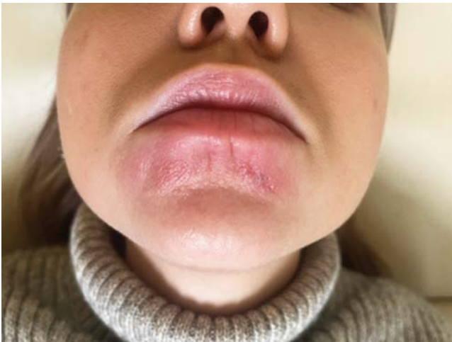
Рис. 4. После проведения первой процедуры обкалывания суспензии бетаметазона дипропионата отмечалось уменьшение плотности отека Fig. 4. After the first injection of betamethasone dipropionate suspension there was a decrease in edema volume

Дифференциально-диагностические признаки представлены в табл. 1.