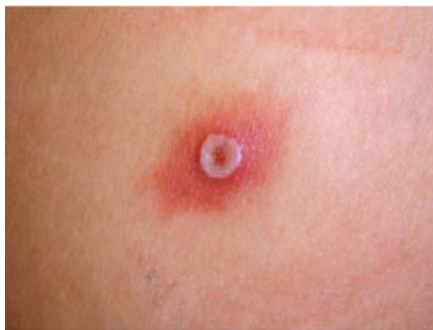
Рис. 1. Узелок доильщиц во время пятнисто-папулезной стадии