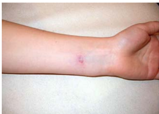
Рис. 4. Узелок доильщиц во время фазы регрессии