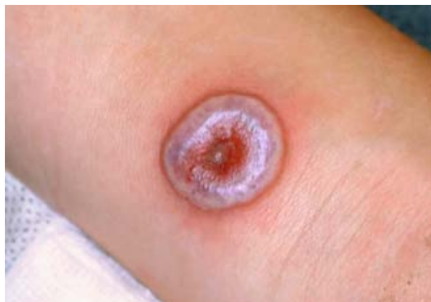
Рис. 2. Узелок доильщиц во время стадии мишени