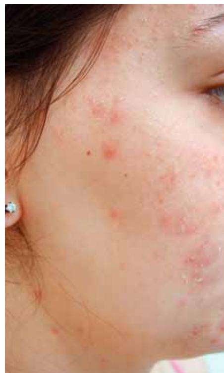
Рис. 2. Состояние кожи щеки пациентки И., 17 лет, до начала терапии

Для лечения акне пациенты получали изотретиноин в форме LIDOSE (Акнекутан). Препарат назначали в дозировке 0,33 \pm 0,06 мг на 1 кг массы тела. Одновременно с лечением ретиноидами пациенты использовали топические препараты, корректирующие побочные эффекты изотретиноина со стороны кожи. Для уменьшения сухости губ назначали препараты, содержащие декспантенол в форме крема (д-пантенол), при активной инсоляции — средства с SPF 25 (Ладиваль, гигиеническая помада). Рекомендованная частота нанесения составляла 6—8 раз в сутки. На кожу лица, с учетом резко континентального климата в регионе Западной Сибири, в зимний период рекомендовали крем Нутритик 5%, в летний период — крем Толеран-Ультра, во время пребывания на солнце — средства с SPF 50 (Ангелиос), на тыл кистей при развитии ре-