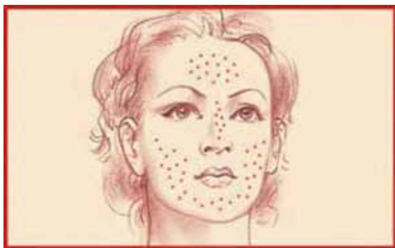
Рис. 1. Схема расположения сальных желез на лице. http://www.peterkaliniak.com/catalogue/cosmetology/facecare/facespots

на участке 1 см 2 , используя стерильный ватный тампон со стерильным оливковым маслом, который помещали в стерильную пробирку. Далее производили пересев в трехкратной повторности на селективную среду Notman-агар (LNA): 10,0 г полипептона, 5,0 г глюкозы, 0,1 г дрожжевого экстракта, 8,0 г бычьей желчи, 1,0 мг глицерола, 0,5 г глицеролстеарата, 0,5 мг Tween 60, 10 мл молока и 12,0 г агара на литр. Чашки с посевом инкубировали в термостате при 32 °С в течение 2 нед. Культуры дрожжей идентифицировали по морфологическим и физиологическим признакам и с помощью анализа нуклеотидных последовательностей D1/D2 региона 26S (LSU) рДНК. Подсчет средних значений КОЕ/см 2 проводили в соответствии с количеством колоний, выросших на плашке с пробы, взятой с участка кожи 1 см 2 .