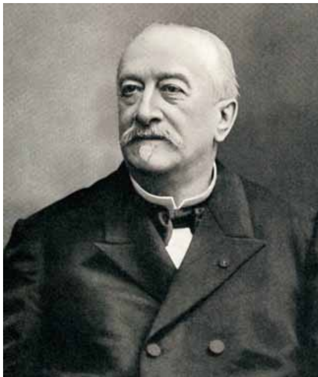
Рис. 1. Ж.А. Фурнье (1832—1914)

В 1867—1876 гг. Фурнье заведует женским венерологическим отделением в Hospital de Louricine и становится начальником по работе с персоналом в той же больнице. В 1869 г. Фурнье впервые стал читать отдельный специальный курс сифилидологии, а в 1876 г. стал основателем отдельной кафедры кожных и сифилитических болезней. До этого курс дерматологии