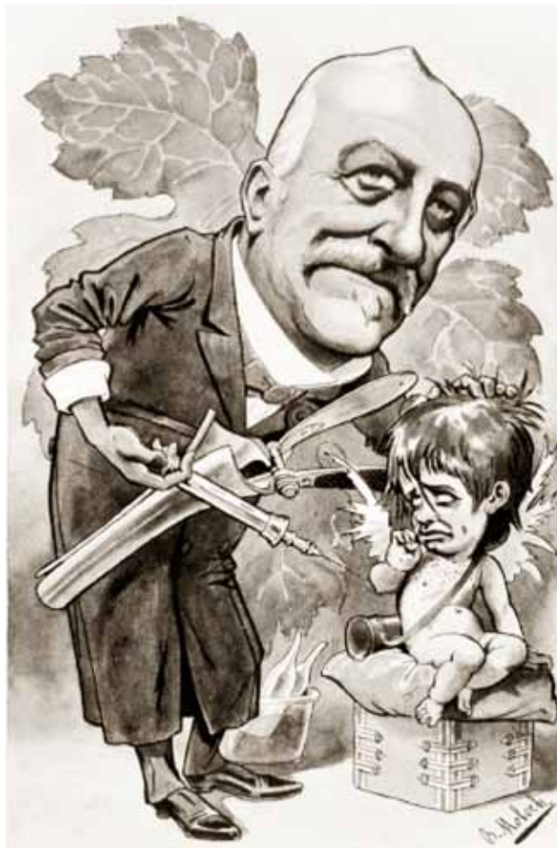
Рис. 3. Карикатура на Ж.А. Фурнье (Chanteclair, 1908)

Ж.А. Фурнье умер 25 декабря 1914 г. Место захоронения Фурнье: Париж, кладбище Pere Lachaise.