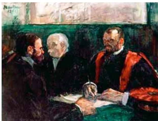
Рис. 4. Анри Тулуз-Лотрек. «Экзамен на факультете медицины» (1901, масло, 63,5 × 79 см)