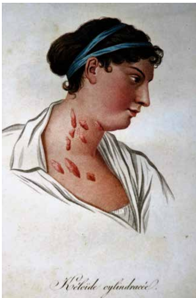
Рис. 2. Келоид. Жан-Луи Алибер (1835 г.). Монография дерматозов (2-е изд.). Париж

Fig. 1. Jean-Louis Marc Alibert (1768–1837)