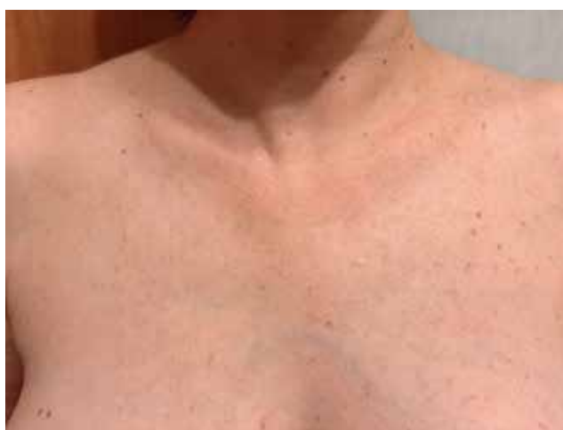
Рис. 5. Регресс всех клинических проявлений дерматомикоза на коже груди через 4 недели после лечения

клинических проявлений дерматомикоза (рис. 5 и 6), однако сохранялась вегето-сосудистая реакция кожи лица и шеи. По результатам трех микроскопических исследований на грибы, проведенных после окончания лечения с интервалом 5 дней, мицелиев и спор в кожных чешуйках, волосах бровей и ресниц обнаружено не было.