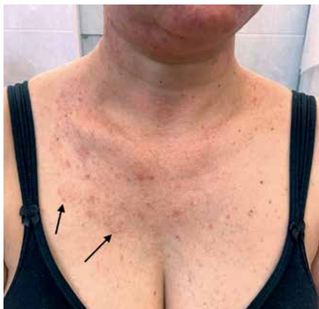
Рис. 3. В центре груди кожа слабо и неравномерно гиперемирована, с отдельными мелкими фолликулярными папулами и пустулами, образовавшими на двух участках справа узкий дугообразный, слегка приподнятый край (отмечены стрелками)

Fig. 3. In the center of the breast, the skin is weakly and unevenly hyperemic, with separate small follicular papules and pustules that have formed a narrow arcuate, slightly raised edge in two areas on the right (marked with arrows)