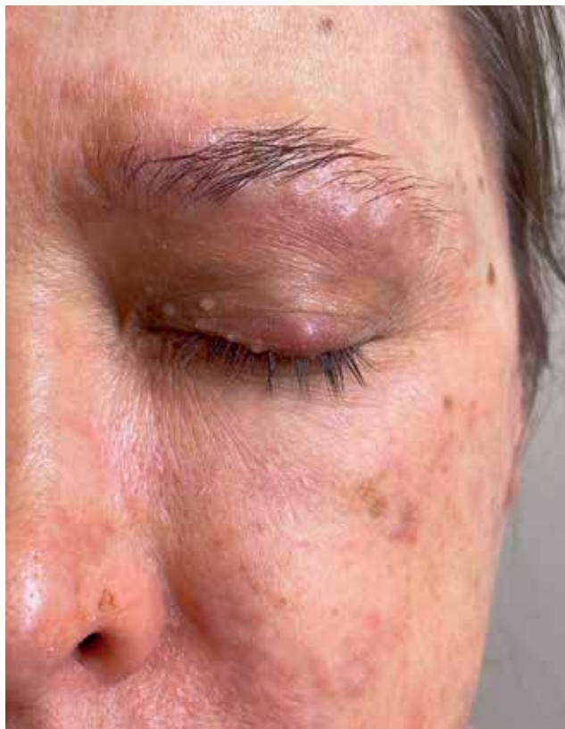
Рис. 2. Застойная гиперемия без четких границ в области верхнего века и брови. Диффузное поредение брови и ресниц верхнего века. Фолликулярные папулы, пустулы и корочки в области наружного края брови и по краю верхнего века

Fig. 1. Uneven congestive hyperemia of the face; on the skin of the forehead, in the orbits and nasolabial areas of erythema thickening with separate small follicular papules-pustules and crusts