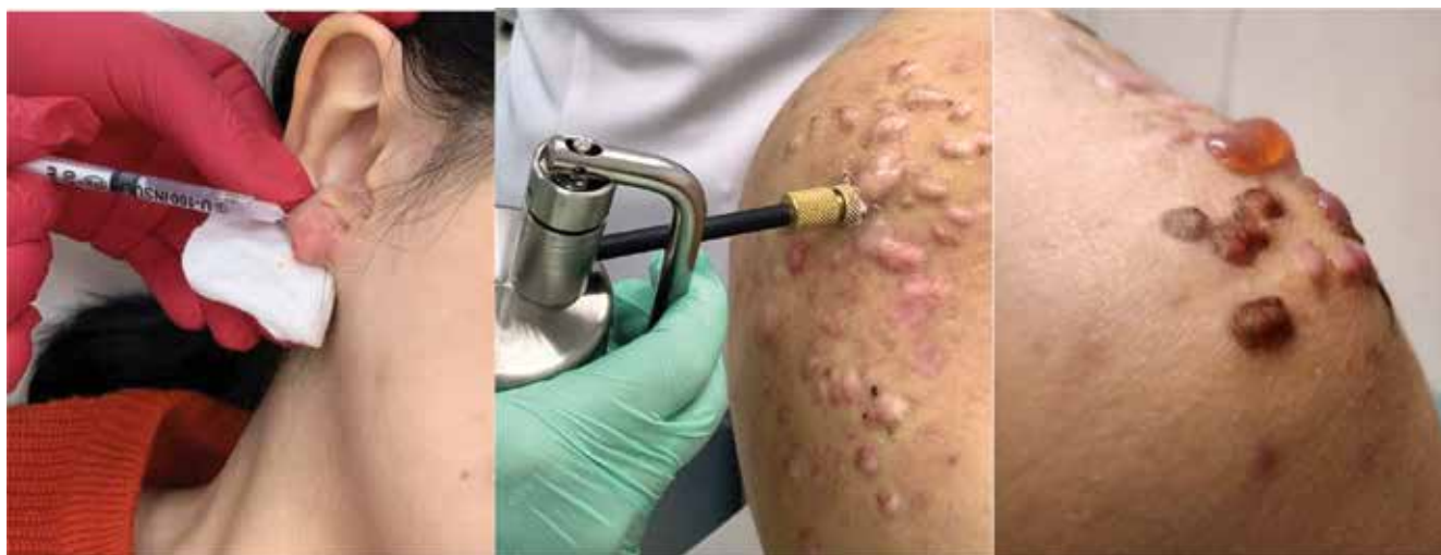
Рис. 7. Криодеструкция гипертрофических постакне-рубцов аппаратом Cryo Pro Fig. 7. Cryodestruction of hypertrophic post-acne scars by Cryo Pro

рубцов. Его можно использовать отдельно или как этап различных методик лечения. Кортикостероиды могут уменьшить объем, толщину и текстуру рубцов, а также облегчить такие симптомы, как зуд и дискомфорт. Стероиды помимо противовоспалительного и сосудосуживающего действия обладают антипролиферативным (антимитотическим) действием. Считается, что стероиды останавливают патологическое производство коллагена с помощью двух различных механизмов: уменьшением количества кислорода и питательных веществ в рубце с ингибированием пролиферации кератиноцитов и фибробластов, а также стимуляцией разруше-