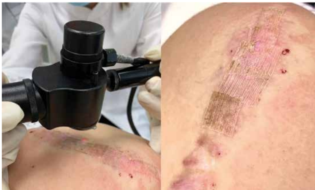
Рис. 6. Работа с гипертрофическими рубцами CO 2 -лазером Fig. 6. Working with hypertrophic scars with a CO 2 -laser