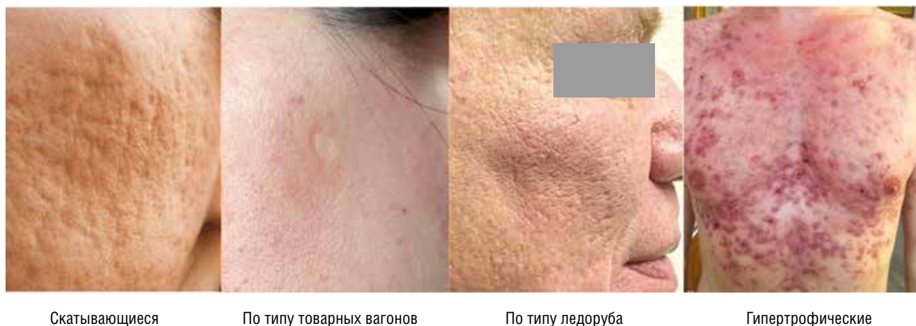
Рис. 2. Разновидности постакне-рубцов на примере пациентов Fig. 2. Varieties of post-acne scars on the example of patients