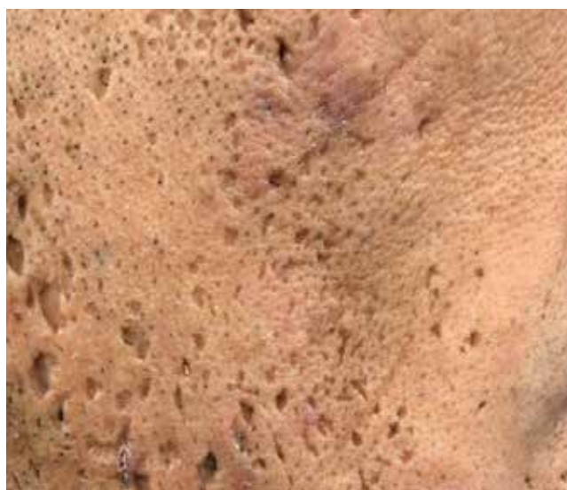
Рис. 3. Все разновидности атрофических постакне-рубцов у одного пациента Fig. 3. All types of atrophic post-acne scars in one patient

и расположение рубцов, а также исходный фототип кожи пациента, чтобы минимизировать потенциальные риски.