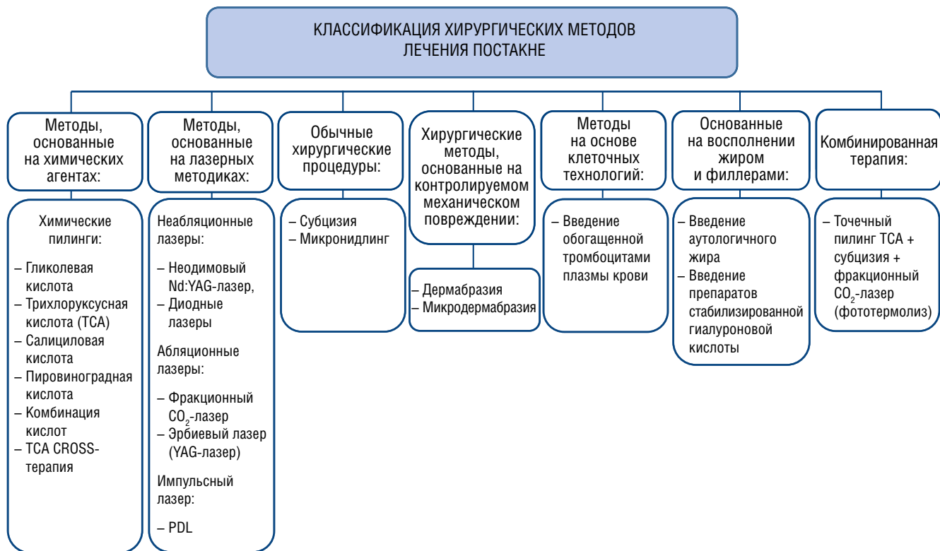
Рис. 5. Классификация инвазивных методов терапии постакне-рубцов