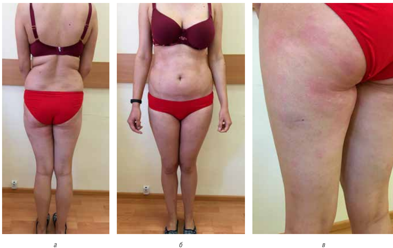
Рис. 5. Клиническая картина пациента Б. после 8 месяцев терапии метотрексатом в дозе 30 мг Fig. 5. Clinical findings in patient B. after treatment of methotrexate 30 mg during 8 months