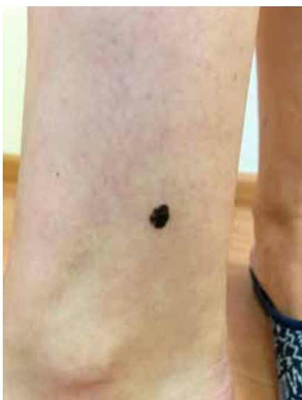
Рис. 7. Пигментное новообразование неправильной формы, темно-коричневого, почти черного цвета на коже правой голени у пациентки С. при поступлении

Fig. 7. Pigmented lesion of irregular shape and dark-brown color on the right shin in patient C.